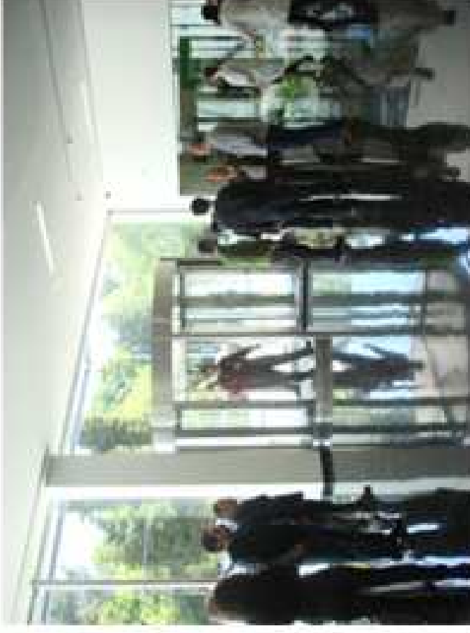
2 - atrium hospitalidade aguardar aqui