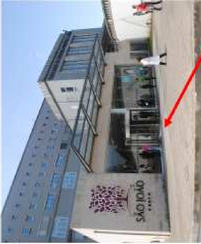
1- atrium hospitalidade entrar aqui